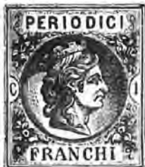
Figure allégorique de l'Italie, coul. sur blanc.