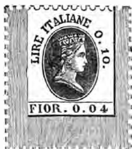
Figure allégorique de l'Italie, coul. sur blanc piqués.

POUR LES PROVINCES DE NANTOLE ET DE VENISE.